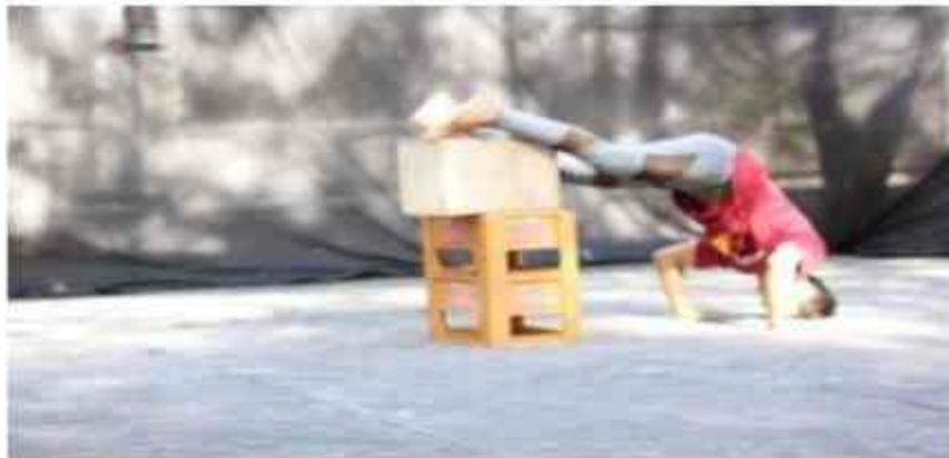
Foto 2: Latihan Monolog berdasarkan pengembangan teknik peran Stanislavski Oleh peraga bernama Alvian Yoga dengan Naskah Super Hero Pahlawan Kesiangan, karya dan Sutradara: Roci Marciano (foto oleh: Rifah Isyah; 2019).